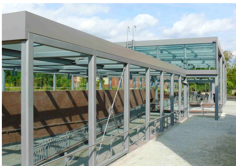
Die überdachte Rampenanlage im ‚Seitenschiff‘ des Zugangsbauwerks